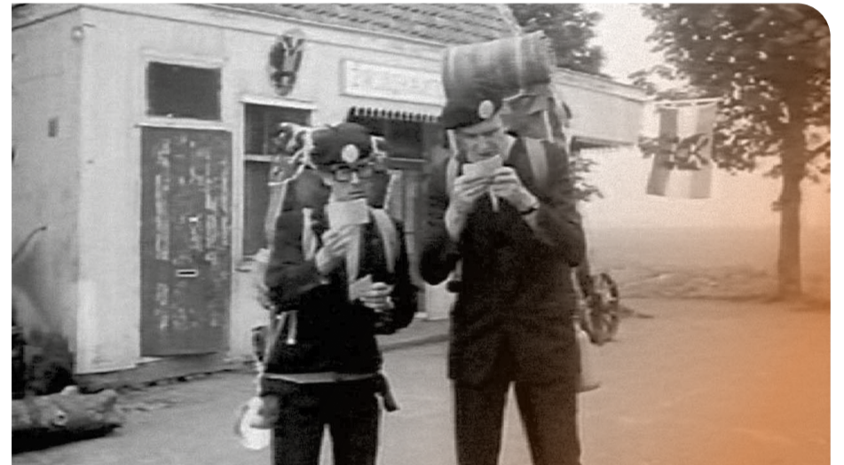
1977. Stilbeeldopname uit de reclamefilm “Kulgarije” met Koot en de Bie.

De commercials van “Van Kooten en De Bie” werden ontwikkeld in samenwerking met het reclamebureau Moussault en waren specifiek gericht op jongeren in de leeftijd van 16 tot 24 jaar. Het idee was dat als de jongere klant werd, die ook op latere leeftijd als klant zou blijven hangen en diens betaalrekening zou blijven gebruiken. Moussault was hetzelfde reclamebureau dat in 1977 de eerste “Giroblauw past bij jou” campagne zou ontwikkelen, die eveneens op jongeren was gericht. Deze grote reclamecampagnes waren opgestart omdat de commerciële banken zich steeds meer op de