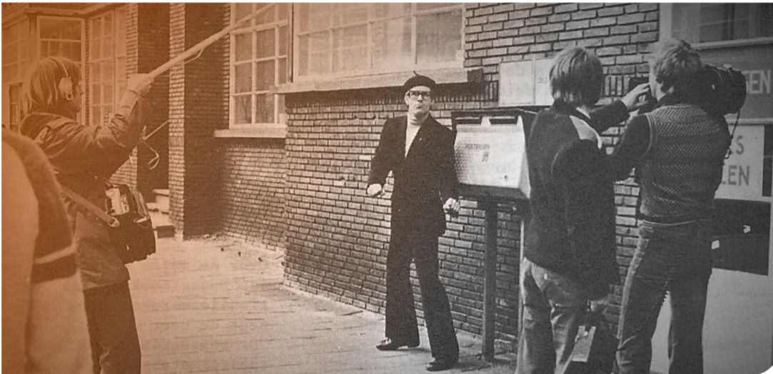
1976. Filmopnames voor de eerste Postgiro reclamefilm van Koot en de Bie.

Na deze eerste bioscoopreclame van het “Simplisties Verbond” volgden in 1977 nog drie filmpjes. Daarin gebruikten Van Kooten en de Bie de Postgiro om boodschappen te betalen op fietsvakantie en om een diner (en fooi) te betalen in een restaurant. Tijdens een wandelvakantie in “Kulgarije” kwamen ze echter zonder contanten te zitten, omdat “Kulgarije” nou net een van de zeer weinige landen was waar